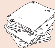
Cloth Paño de limpieza Chiffon