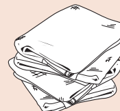
Cloth Paño de limpieza Chiffon